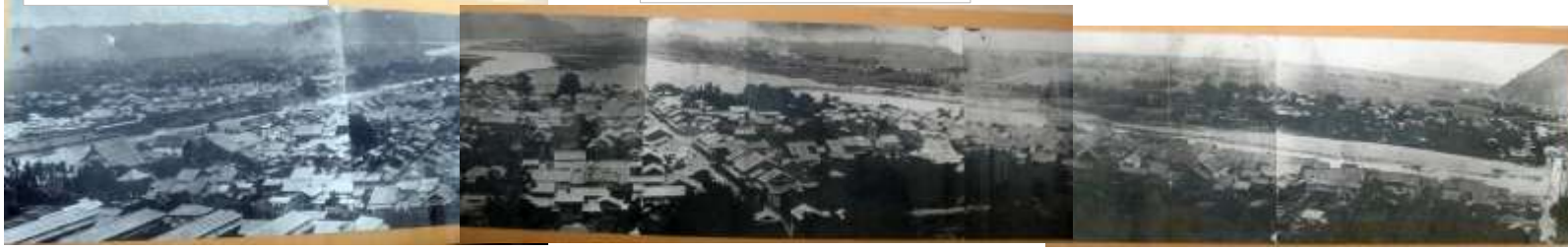
宮崎県 延岡城より市街