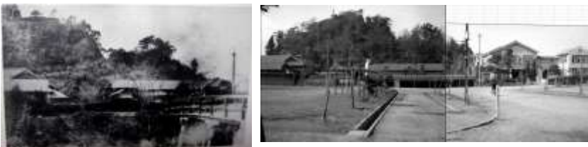
明治及び昭和初期 現市役所より城山を望む